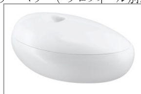
アクサーマソー オーバルボックス ¥55,650