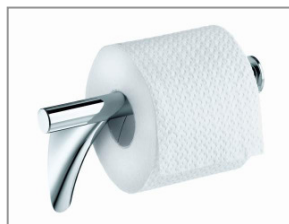
アクサーマソー ペーパーホルダー ¥44,100