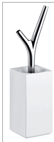
アクサーマソー トイレブラシ ¥60,900