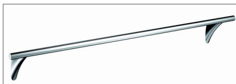
アクサーマソー タオルバー (600mm) ¥74,550