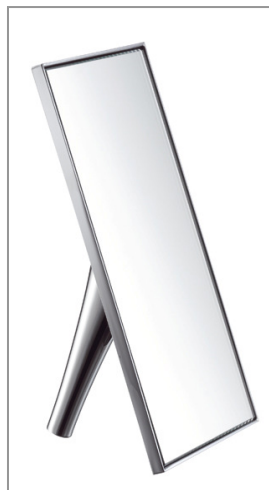
アクサーマソー フリースタANDINGミラー ¥85,050