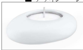
アクサーマソー キャンドルホルダー ¥22,050